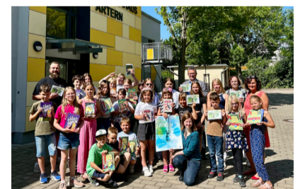
Aktion „Ich bin eine Leserratte“ in Artern