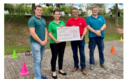
Kinder- und Jugendförderverein Artern e. V.