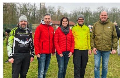
SV Glückauf Sondershausen e. V.