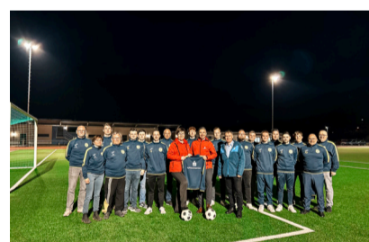
BSV Eintracht Sondershausen e. V.