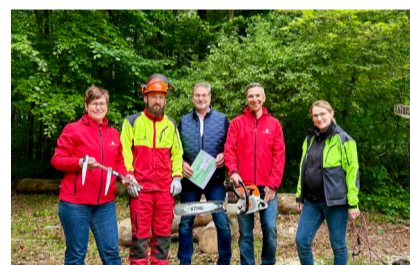
Waldjugendspiele im Kyffhäuserkreis

ausgeschüttet. Gefördert wurden unter anderem mit der Sparkassen-Kunststiftung die Schlossfestspiele in Sondershausen, die Konzertreihe „Musik im Kloster“ in Roßleben, der 29. Carl-Schroeder-Wettbewerb in Sondershausen und die Jahreszeitenkonzerte in der Klosterruine Göllingen. Ausschüttungen der Sparkassen-Museumsstiftung gingen an das Panorama-Museum und Regionalmuseum Bad Frankenhausen zur Unterstützung von Ausstellungen sowie an das Schlossmuseum Sondershausen unter anderem als Druckkostenzuschuss für die Schriftenreihe „Sondershäuser Beiträge“.