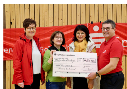
Förderverein der Staatlichen Grundschule Bottendorf e. V.