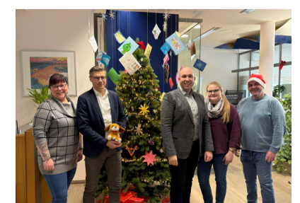
Aktion „Wunschweihnachtsbaum“ in Ebeleben und Roßleben