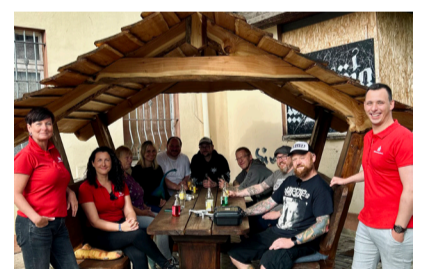
White Pig e. V. Bad Frankenhausen