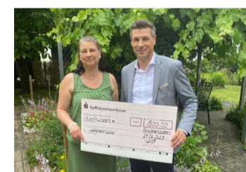
Lebensbrücke e. V. für die Durchführung eines Sommerfestes