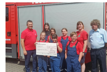
Jugendfeuerwehr Artern e. V. für die Durchführung des Kreiszeitlagers