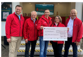
DRK Kyffhäuserkreisverband e. V. für die Durchführung des Erste Hilfe Jugendrotkreuzwettbewerb