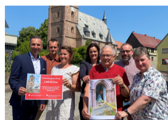
Denkmal- und Geschichtsverein Barockes Bendeleben e. V. für Restauration Glocke der St. Pankartiuskirche Bendeleben