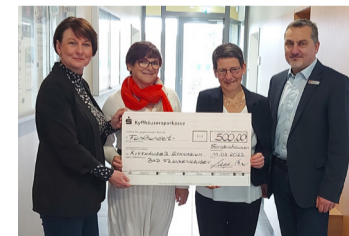
Freundeskreis des Kyffhäuser Gymnasiums Bad Frankenhausen e. V. für die Durchführung Tag der offenen Tür

Auch die Erträge unserer Stiftungen für den Kyffhäuserkreis , der Sparkassen-Kunststiftung und der Sparkassen-Museumsstiftung, kommen satzungsgemäßen Projekten im gesamten Geschäftsgebiet zugute. So wurden im letzten Jahr