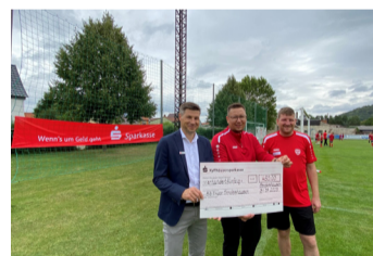
SG Empor Sondershausen-Stockhausen e. V. für Durchführung Ferien-Fußballcamp